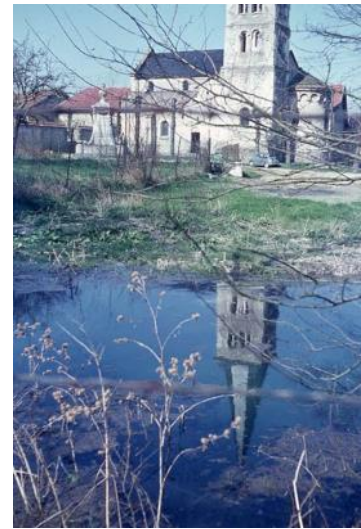
(La Muire à l'église - 1966)