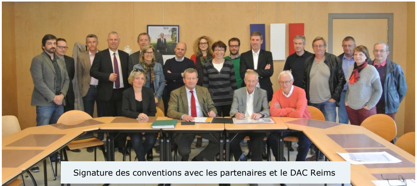
Signature des conventions avec les partenaires et le DAC Reims